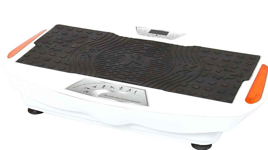
Platforma wibracyjna wibrująca treningowa wyszczuplająca - Masażer ciała 3D